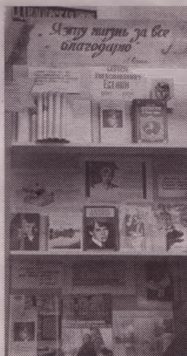
С названием кратким – «Русь».